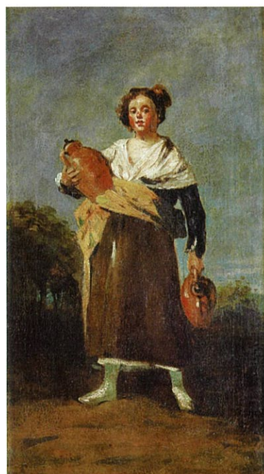
フランシスコ・ホセ・デ・ゴヤ・イ・シルエンテス《水を運ぶ女性》