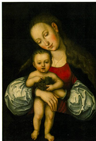
ルーカス・クラナハ(子)《聖母子》