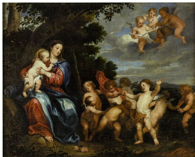
アンソニー・ヴァン・ダイク《エジプトへの逃避途上の休息》