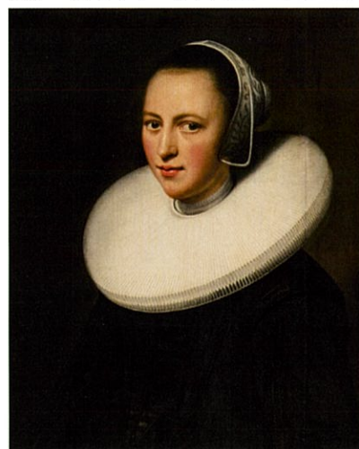
レンブラント・ファン・レイン《黒襟を着けた女性の肖像》1644年