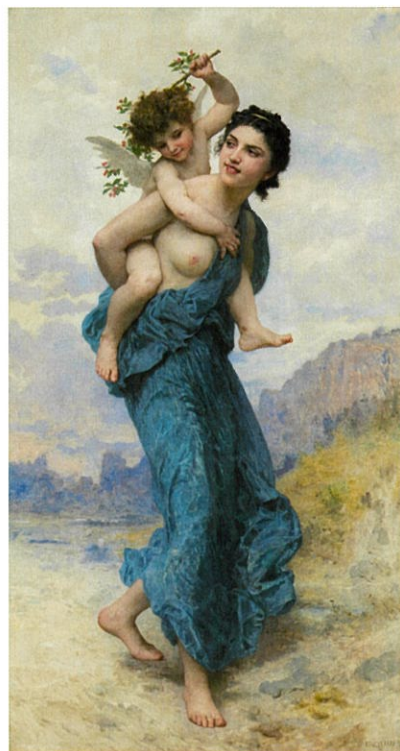
ウィリアム＝アドルフ・ブーグロー《ヴィーナスとキューピット》1903年