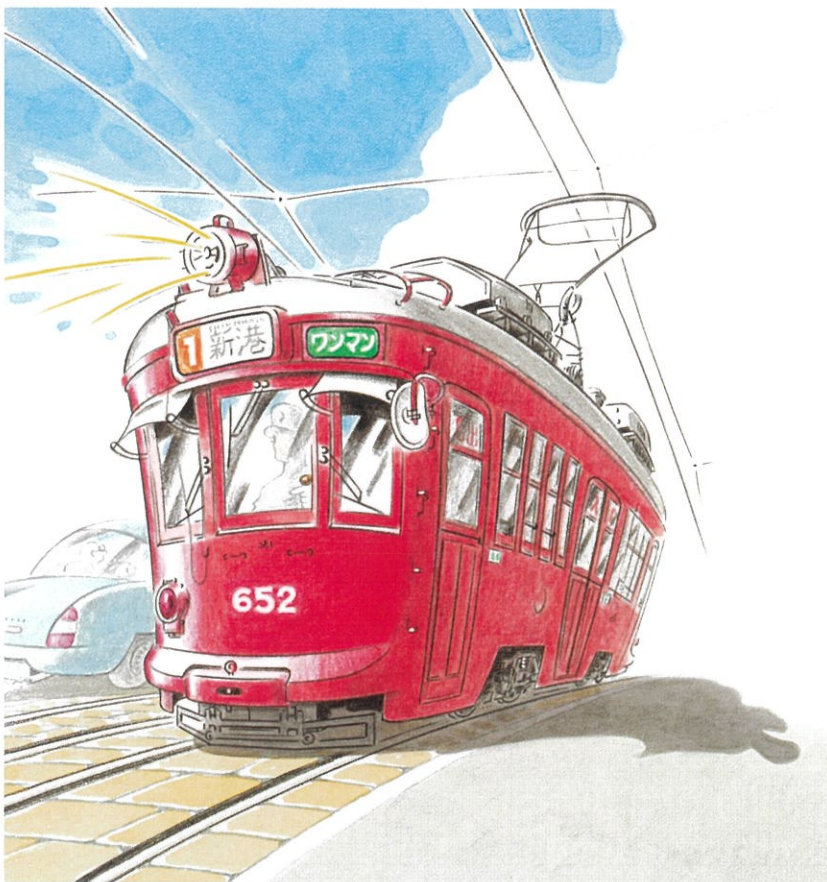
「すすめ ろめんでんしゃ」2017年、福音館書店