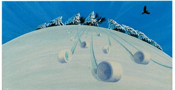
「ゆきまくり」1985年、福音館書店