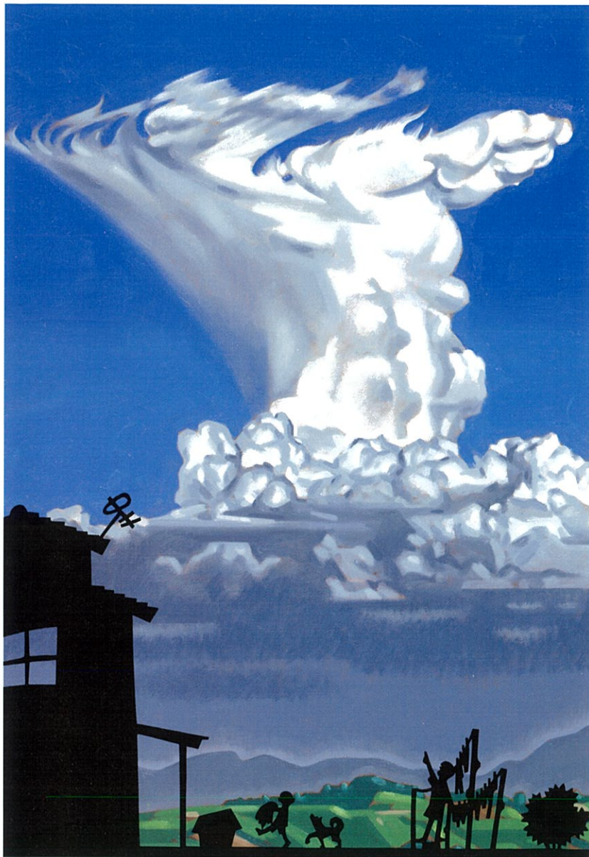
「にゅうどうぐも」(根本順吉 監修)1996年、福音館書店