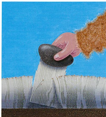
「しもばしら」2002年、福音館書店

東広島市立美術館では、1982年の「第1回現代絵本作家原画展」開催以来、33回にわたって現代絵本作家と作品の魅力を広く紹介してきました。新美術館移転後の初開催となる本展では、『どろだんご』や『にゅうどうぐも』などで知られる広島ゆかりの絵本作家・野坂勇作の世界をご紹介します。自然や乗り物、遊びなどを題材に、その内容によって油絵や版画など様々な技法で作風を変化させる絵本は、いずれも丁寧な取材に基づいて作られています。本展では、約130点の原画を中心に、絵本づくりの資料も併せて展示し、野坂勇作の絵本世界の魅力に迫ります。