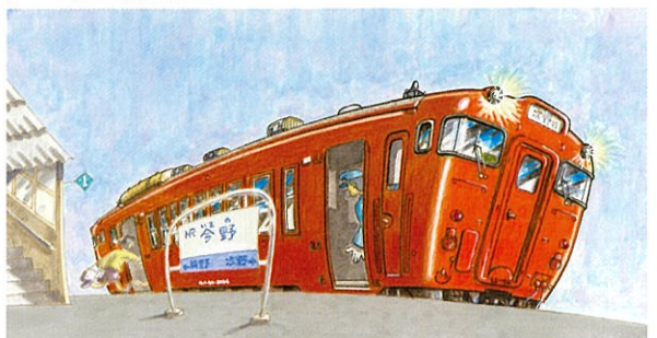
「オレンジいろのディーゼーカー」2010年、福音館書店

関連イベント ※新型コロナウイルス感染拡大の影響により、内容を変更する場合がございます。