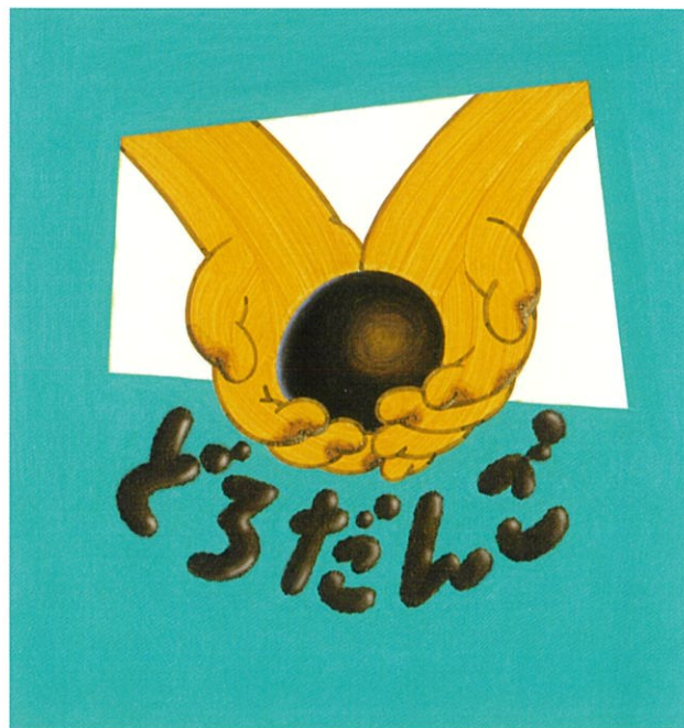
「どろだんご」(田中義行 文)1989年、福音館書店