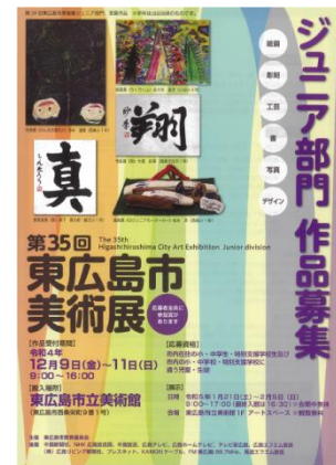
ジュニア部門作品募集