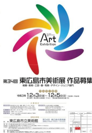
作品受付ポスター