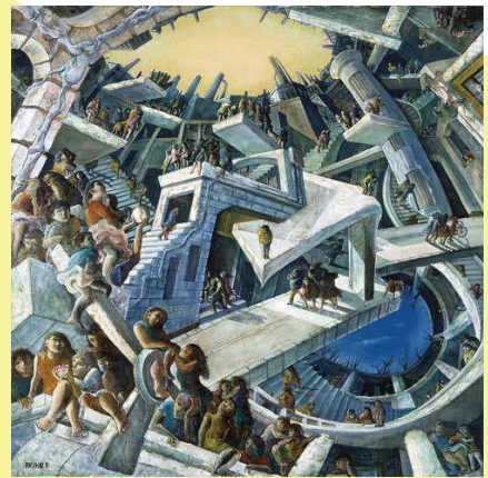
遠藤彰子《沈める街》1989年

【会場】 2階展示室B 【休館日】 月曜日 【閉館時間】 9:00-17:00(入館は閉館30分前まで) 【観覧料】 一般300(240)円、大学生200(160)円*、高校生以下無料* ※( )内は20名以上の団体料金 *学生証をご提示ください ※後期高齢者医療被保険者証・身体障害者手帳・療育手帳・精神障害者保健福祉手帳の交付を受けている方は、無料でご覧いただけますので、受付で各手帳等をご提示ください。(スマートフォンアプリ「ミラロID」も利用可能) 【主催】 東広島市立美術館