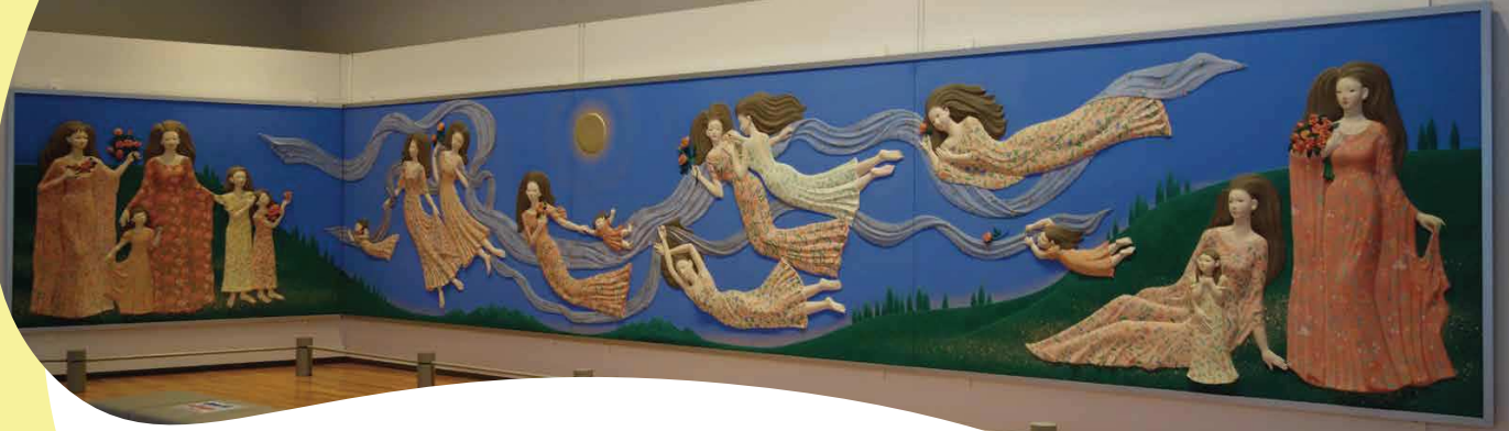
奥田小由女《天翔る讃歌》1989年、広島県蔵