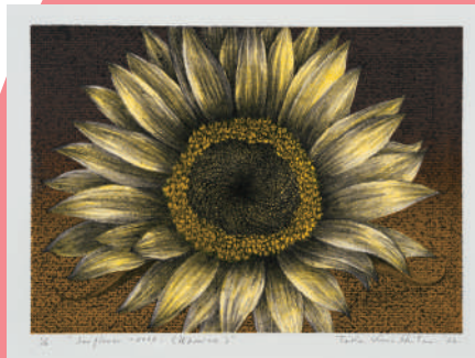
木下泰嘉《Sun flower-2022(Ukraine)》2022年 リトグラフ、紙

東広島市立美術館 HIGASHIHIROSHIMA CITY MUSEUM OF ART