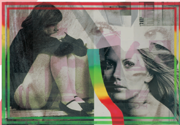
木村光佑《現在位置-フレーミングA》1971年 リトグラフ、シルクスクリーン、紙