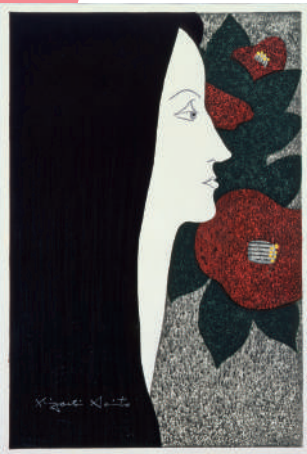
斎藤清《カメラ》1948年 木版、紙 ©Hisako Watanabe