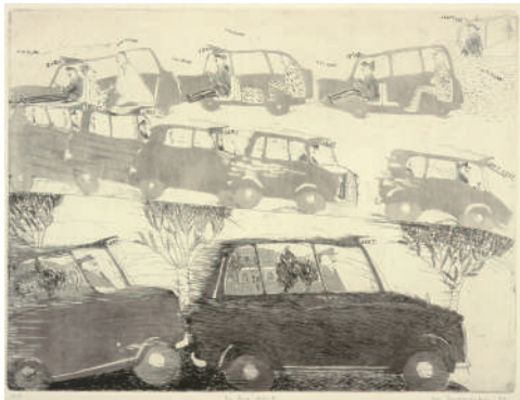
山本裕子《To the Park》1978年 アクアチント、ソフトグラウンドエッチング、紙