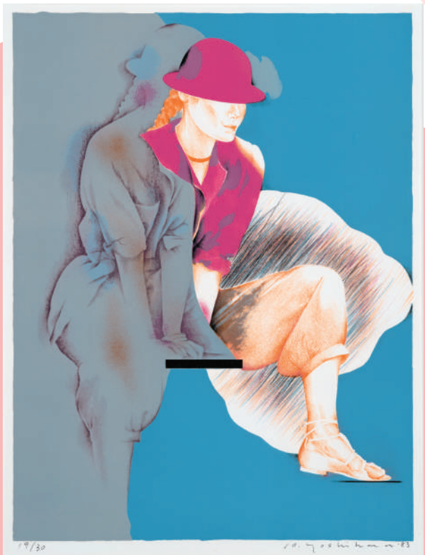
吉原英雄《SEPTEMBER》1983年 リトグラフ、紙 ©Hideo Yoshihara