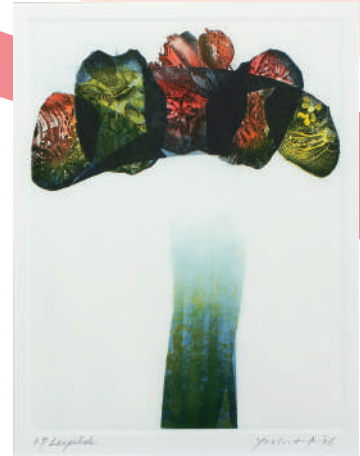
有地好登《Lampshade》2006年 エッチング、アクアチント、紙

絵の部分を彫り、その凹んだ部分にインクをつけ、プレス機で圧力をかけて刷り取る方法