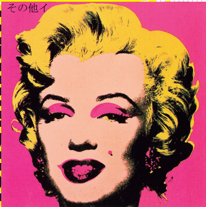
アンディ・ウォーホル