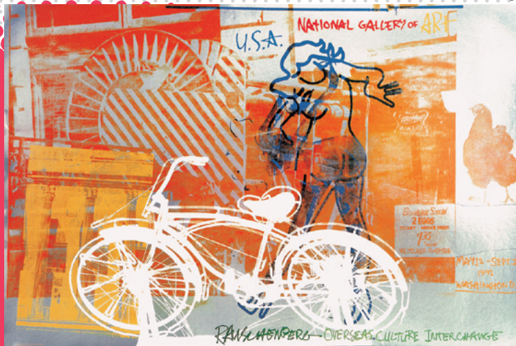
ROBERT RAUSCHENBERG ロバート・ラウシェンバーグ