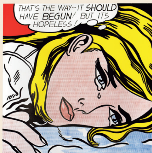
roy lichtenstein kunsthalle bern 23 februar bis 31. märz 1968