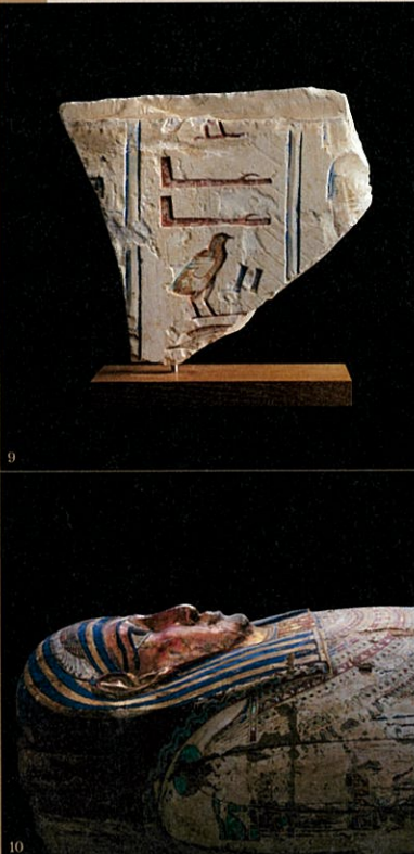
1. ホルスの4人の息子たちの護符とプタ・ハツカル・オシリス神のミイラ/末期王朝~プトレマイオス朝時代 2. ウラエウス扇子装飾/新王国時代・第18王朝 3. 扇子/末期王朝時代 4. 王とアトム神のレリーフ/第3中間期・第22王朝 5. 役人の胸像/末期王朝時代・第26王朝 6. レリーフ装飾のある容器/ローマ支配時代 7. 花をモチーフにした胸飾り/新王国時代 8. レイオウの化粧用容器/新王国時代 9. ヒエログリフが刻まれたレリーフ/末期王朝時代 10. 人型木棺/プトレマイオス朝時代