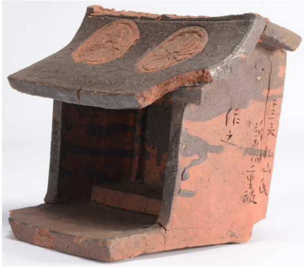
下三永発見の瓦製祠