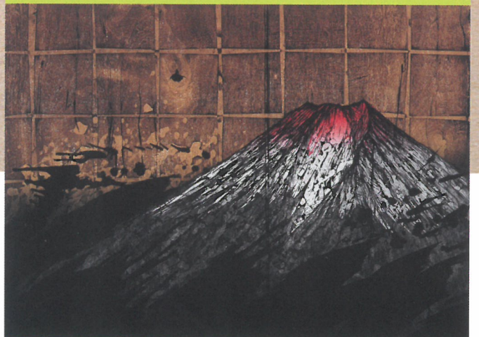
木下泰嘉「Strawberry Fields Forever-1-Y (Mt. Fuji-1)」2005年