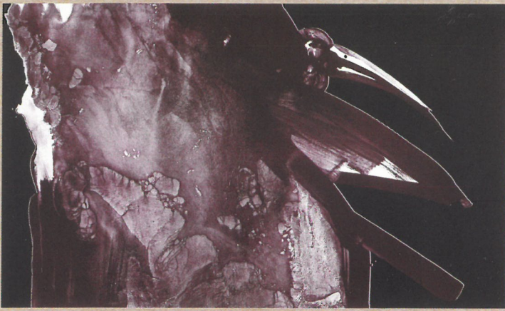
金光松美「夜に飛ぶ」1977年