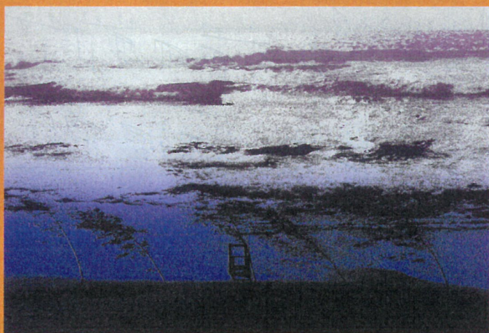
森岡 完介「Beethoven at the beach-Message86-9P」(1986年)