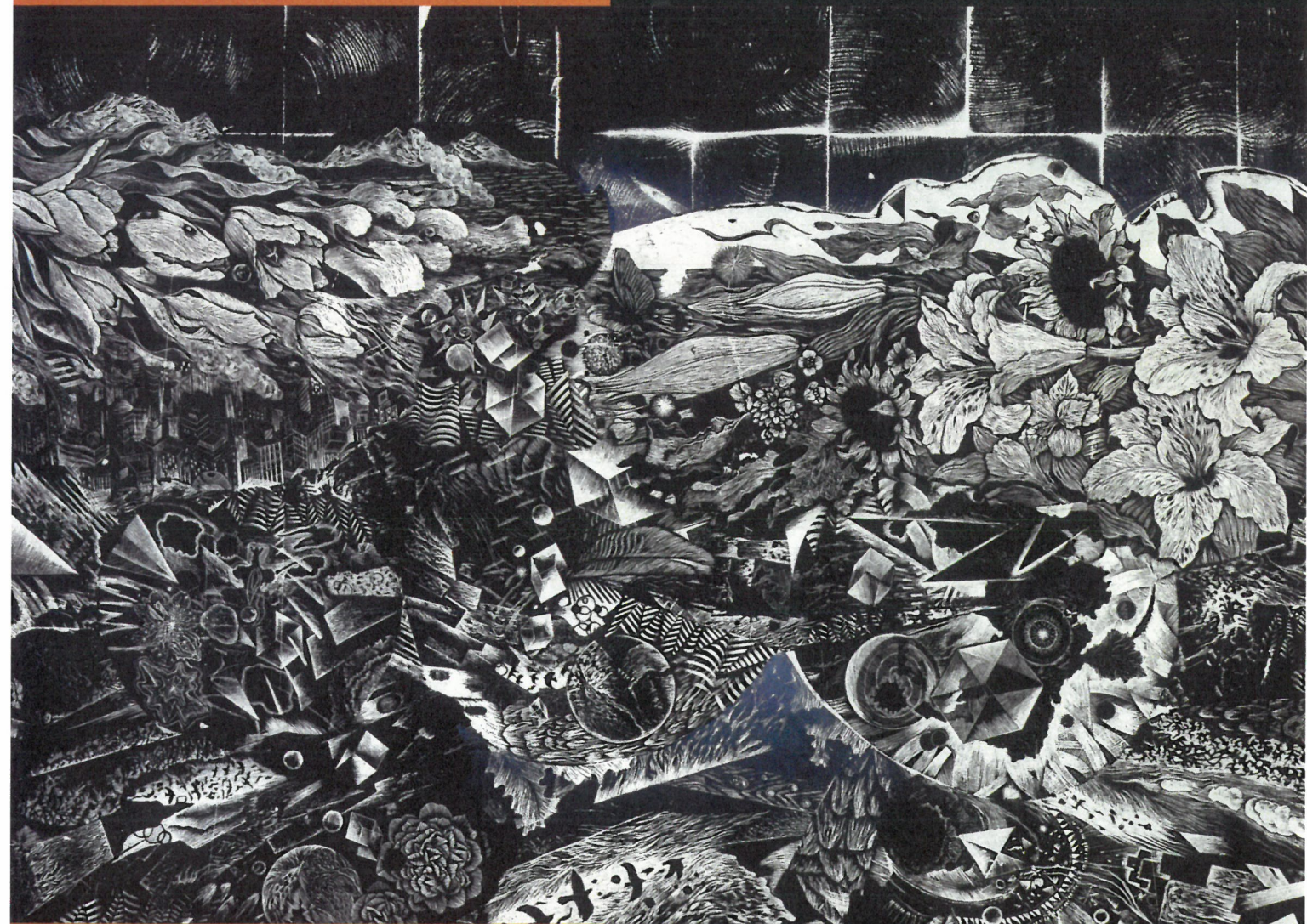
栗田 政裕 [WOOD ENGRAVING STORY 惑星X] (2002年)