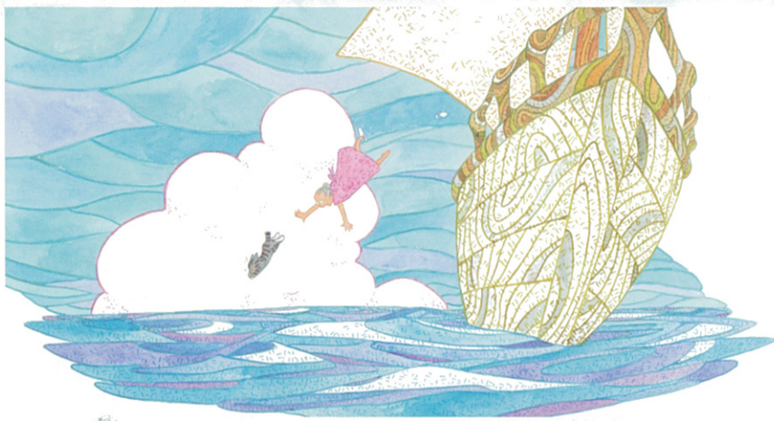
「とらねことらたとなつのうみ」 PHP 研究所 ©Kimiko Aman & Gen Hirose 2016