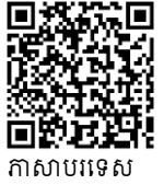
កាសាបរទេស

ព័ត៌មានខាងក្រោមនេះក៏មានជាភាសាអង់គ្លេស ( ហើយនឹងភាសាផ្សេងៗទៀត ) នៅវេបសាយរបស់ក្រុង ហ៊ីហ្គាស៊ីហ៊ីរ៉ូស៊ីម៉ា (Higashihiroshima) តាមរយៈអាសយដ្ឋានខាងក្រោម៖