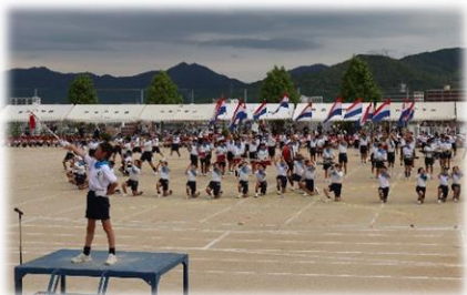
オープニング 5年生の鼓笛

PTAの皆様には、リサイクル市やジュース・パンの販売等で大変お世話になりました。また、今年の運動会は多くの保護者の方がボランティアとして協力してくださいました。たくさんの方の温かい支援で子ども達の心に残る運動会となりました。本当にありがとうございました。