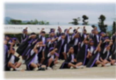
4年生表現 〈酒都の舞〉