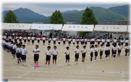
2年生のダンス〈アロハ！ホアーオ ケイキ ～こんにちは！チャレンジ2年生～〉