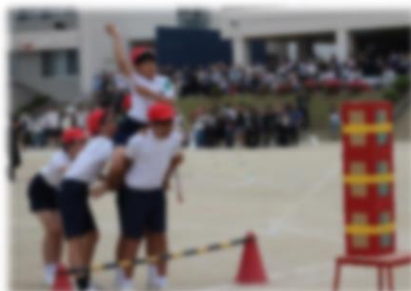
6年生団体戦 〈躍進の友情馬〉