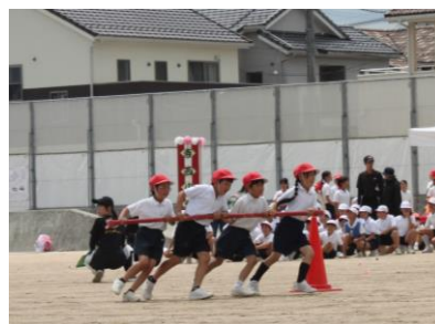
4年 寺西ハリケーン