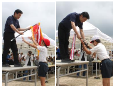
優勝旗・準優勝楯授与