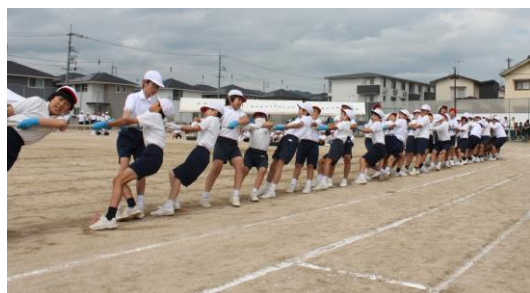
5年 奪って!引いて!スイッチON!!