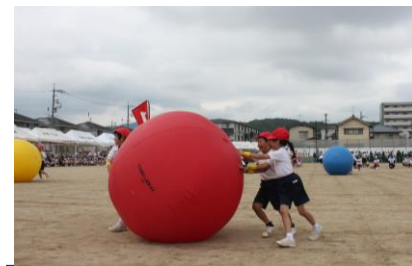
2年 セーの!でぐんぐん!大玉ころころ