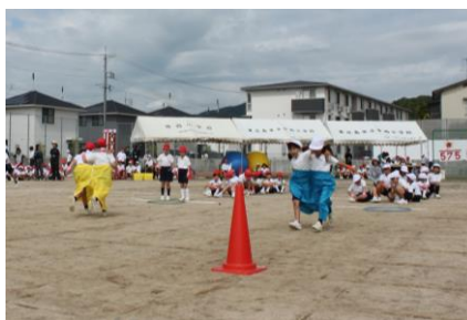
3年 3!SUN!パワーでもえろ! デカパン競走!!