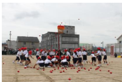
1年 踊って、投げて!かわいすぎて滅!