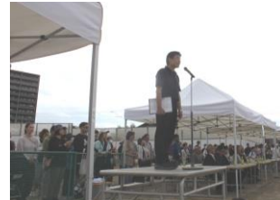
開会式 学校長挨拶