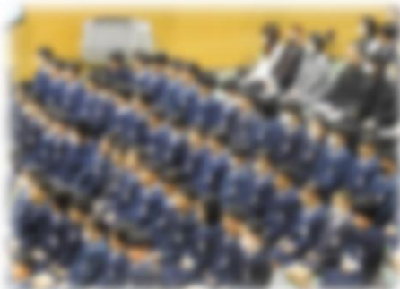
【卒業証書授与式の様子】